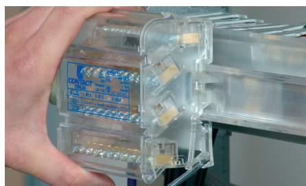
Aggancio su guida DIN Coupling on DIN rail