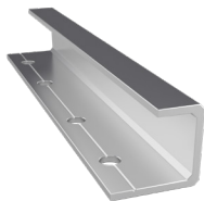
NTH2198 Giunzione alluminio 200 mm