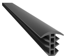
VT0030 Guarnizione EPDM sezione "T"